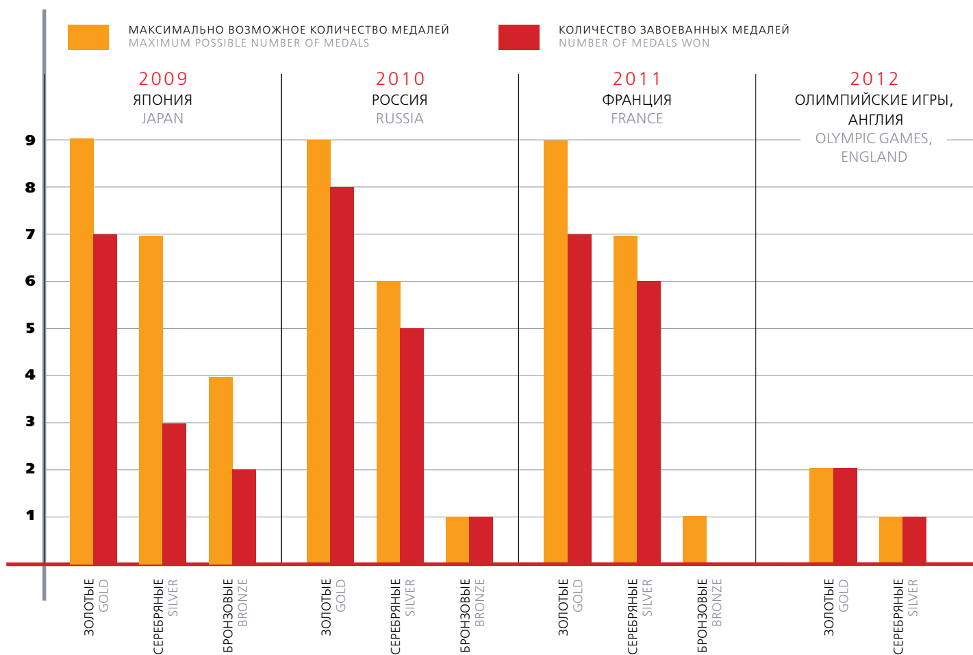
FIG. 1. THE RESULTS OF WOMEN GYMNASTS' PERFORMANCE IN THE OLYMPIC CYCLE 2009–2012 (WORLD CHAMPIONSHIPS 2009, 2010, 2011 AND THE GAMES OF THE 30TH OLYMPIAD 2012)

Анализируя результаты выступления российских гимнасток на международном уровне в олимпийском цикле 2009–2012 годов, отмечаем следующее: